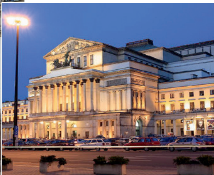
Die Warschauer Premiere seiner »Halka« machte Moniuszko 1859 zum Operndirektor des Teatr Wielki – und zum Nationalkomponisten Polens.